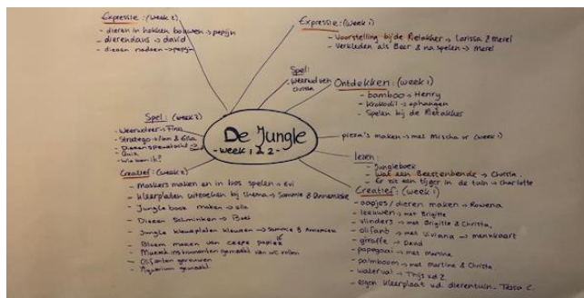
Afbeelding: Thema Jungle, week 1 en 2 zomervakantie 2020

Iedere vakantie nemen we het thema en de(3) voorgestelde (week)activiteiten door. Aan de hand van deze suggesties gaan we in gesprek met de kinderen. En dagen we de kinderen uit om op eigen ideeën te komen. We noteren de ideeën op het woordweb met de namen van de kinderen erbij. Op deze manier hebben de pm'ers oog voor interactie en krijgen alle kinderen de kans om mee te denken en beslissen over de dag invulling en het activiteitenaanbod. Iedere dag ontstaat er een programma dat door de kinderen en pm'ers wordt vormgegeven en uitgevoerd. Intrinsieke motivatie, authenticiteit, en talent worden zo ten volle benut.